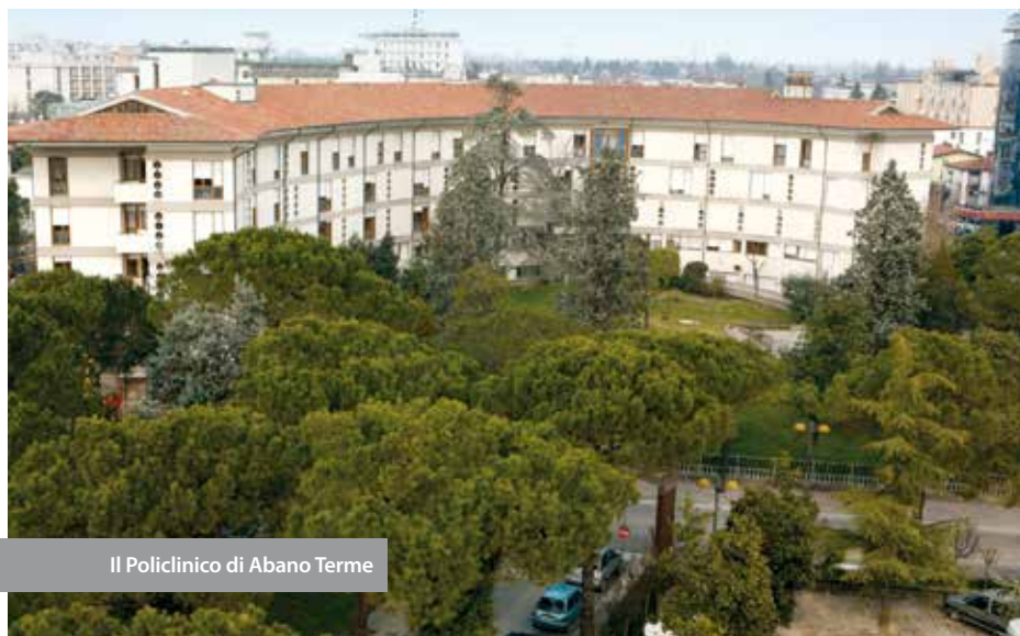
Il Policlinico di Abano Terme

Seguendo questa filosofia, il Policlinico ha acquistato rilievo non più soltanto in ambito