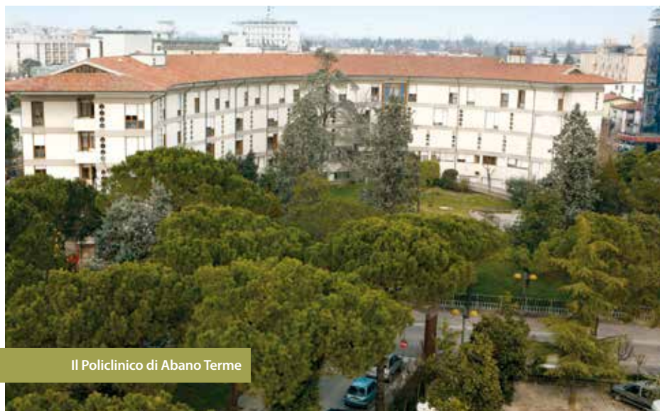
Il Policlinico di Abano Terme

Seguendo questa filosofia, il Policlinico ha acquistato rilievo non più soltanto in ambito